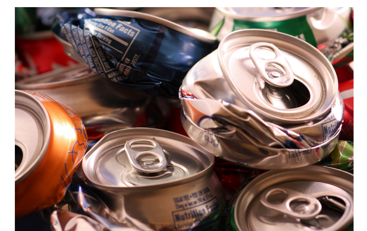
Latas de Aluminio