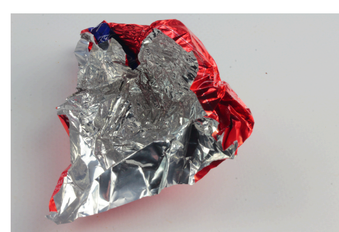
Envolturas de Comida