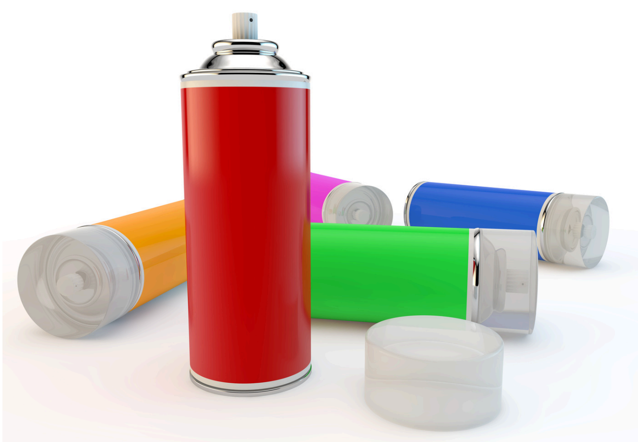
Envases de Aerosol