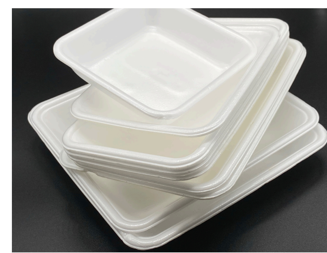
Contenedores de Unicel