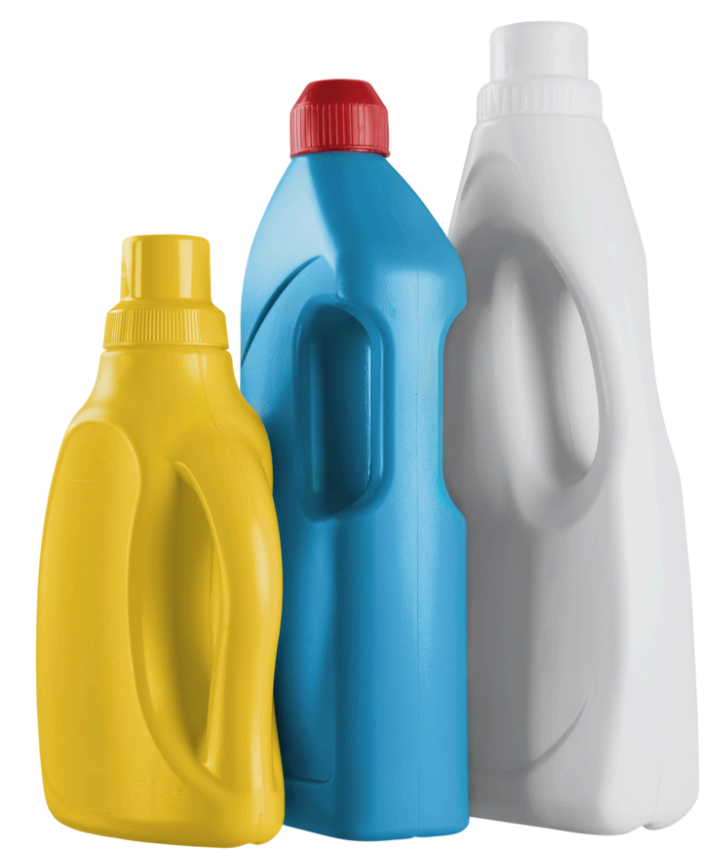
Botellas de Detergentes