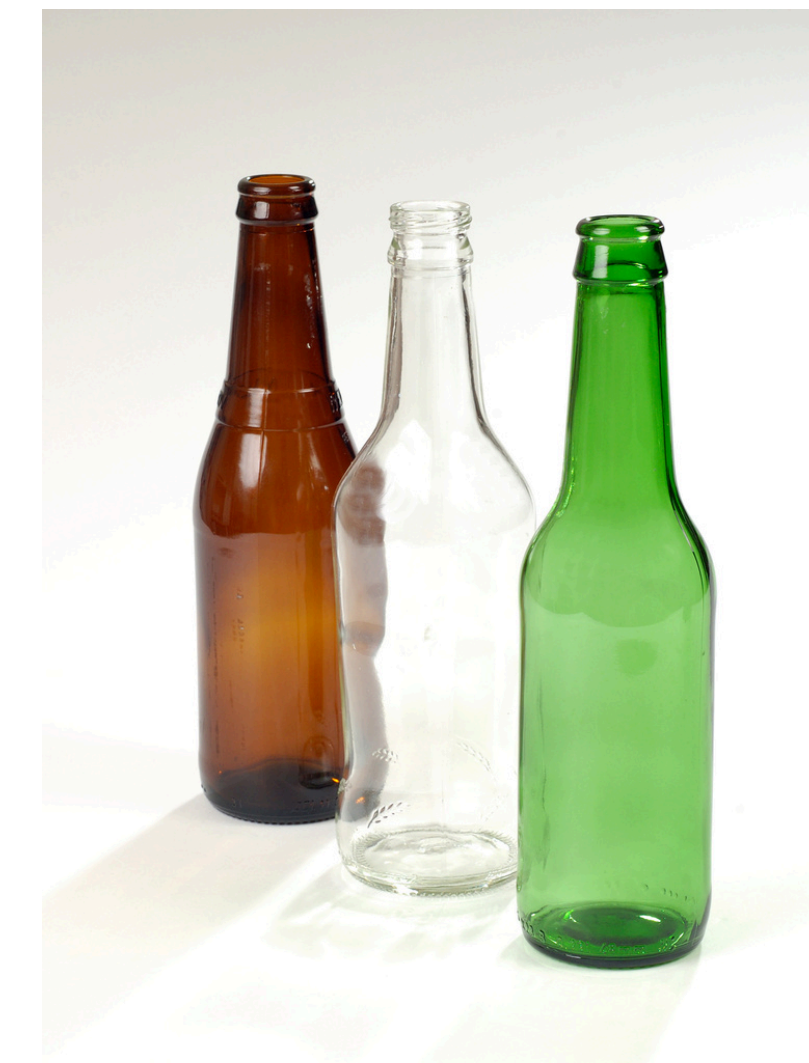
Envases de Vidrio